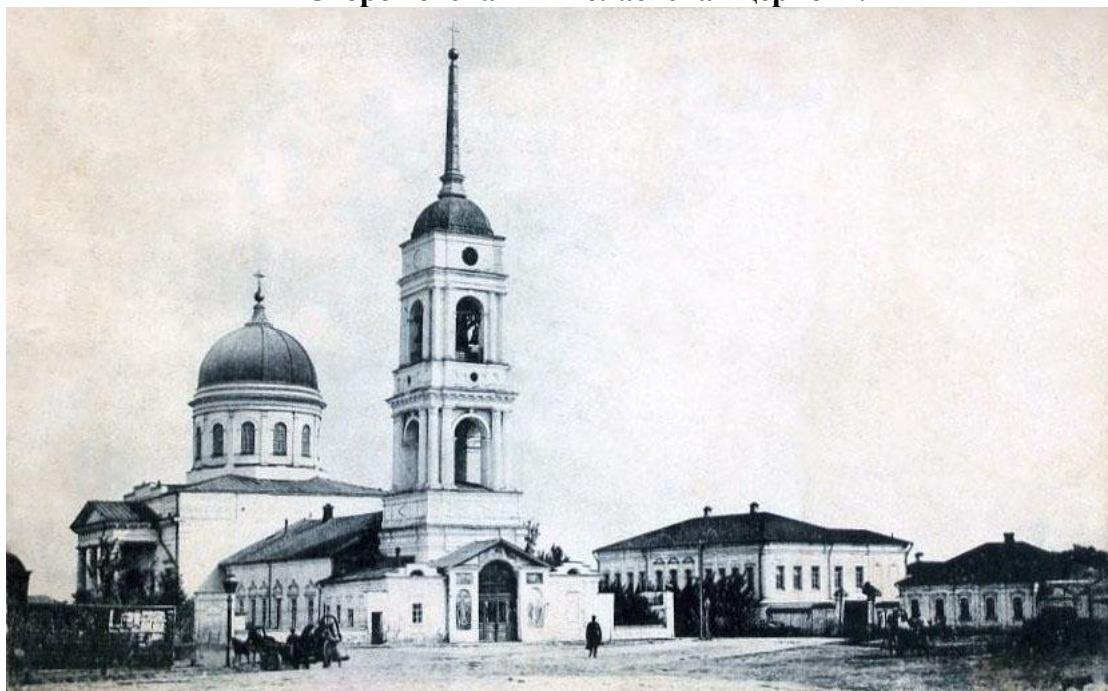
Сторожевская Николаевская церковь.

6 апреля 1930 года на заседании Президиума Козловского Горсовета постановили: «Все помещения бывшего женского монастыря закрепить за Отделом Народного Образования предложив последнему в период 3-4 месяцев произвести капитальный ремонт, согласно сметы, незанятой части помещения... Предложить ОНО отводимые ему помещения бывшего монастыря и имеющийся при них земельный участок превратить в культурный уголок, как имеющий к этому предпосылки». В настоящее время монастырский комплекс вместе со зданием домово́й церкви используются под жилье.